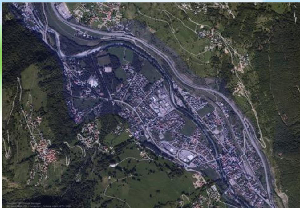
Plan de l'onde de submersion du barrage de Tignes (scénario le plus pessimiste).