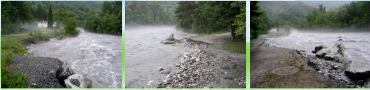
Crue de Mai 2008 - La berge de l'Isère à Bellecombe