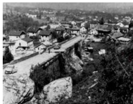
Eboulement de « Roche Plate » de 1937